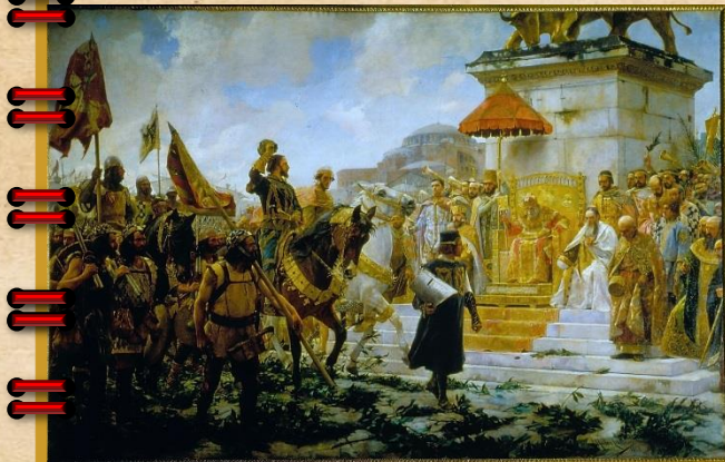
José Moreno Carbonero, 1888. Entrada de Roger de Flor en Constantinopla . Óleo sobre lienzo 35 x 550 cms. Palacio del Senado. Madrid.

sus acres enemigos en Italia)». (Guillermo Fatás, Prontuario Aragonés del Reino y la Corona de Aragón , 2014).