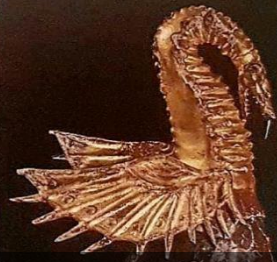
Cimera del rey Martín I el Humano realizada en Mallorca (1396-1410). Armería del Palacio Real. Madrid.