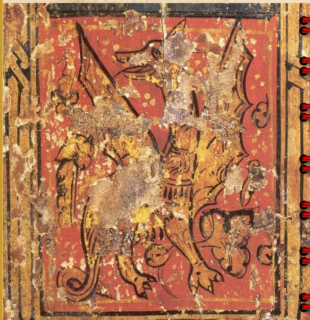
Divisa del Dragón Alado. Palacio de la Aljafería. Zaragoza.

Pedro IV el Ceremonioso introduce en la emblemática regia la representación de un dragón alado en calidad de cimera de yelmo; convertido después en tierras valencianas, turoleses y otras de realengo aragonés en el 'rat penat' o murciélago.