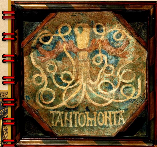
Divisa de Fernando II de Aragón. Casetón del artesonado de la Sala de Deliberaciones, Palacio de la Aljafería de Zaragoza.