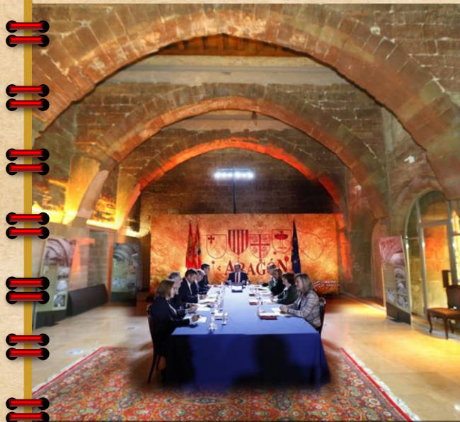
11 dic. 2018. Reunión del Consejo de Gobierno de Aragón en la Sala Capitular del Real Monasterio de Santa María de Sigena.