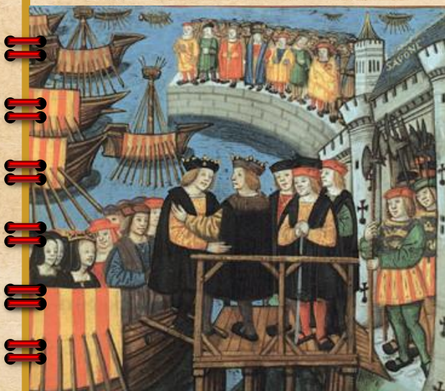
Entrevista de Fernando II de Aragón con Luis XII de Francia en el puerto de Savona, territorio de Génova, en junio de 1507. Detrás del rey, la reina Germana de Foix y, probablemente, el Gran Capitán. Chroniques sur les gestes du christianissime Loys douzieme de ce nom. Paris, Biblioteca Nacional de Francia.